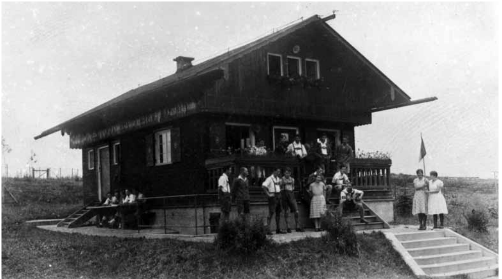
Das Bild aus dem Nachlass von Georg Geißler zeigt unsere Naturfreunde mit ihrer Fahne. (Langwimpel der Jugend)

Die Geschichte der Jugendherberge in Freising ist eng mit dieser allgemeinen Wander- und Freizeitentwicklung zu Beginn des letzten Jahrhunderts verbunden, ähnlich wie die der Naturfreunde.